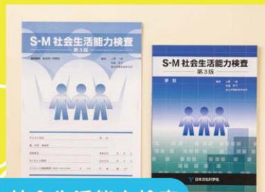
S-M社会生活能力検査

「Vineland-II」や「KIDS」などを使って将来のために自立支援を行います。